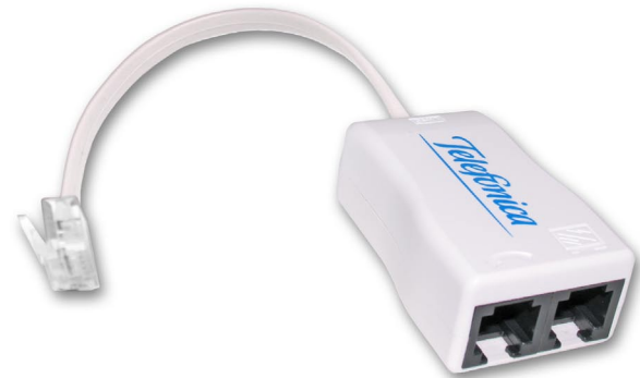
Z-369P2J microfiltro residencial ADSL