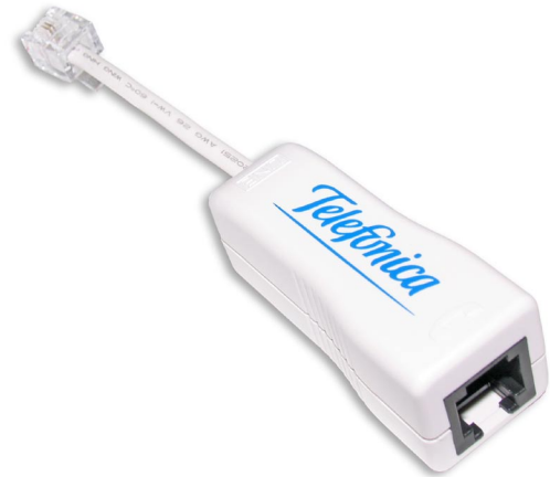
Z-369LS microfiltro residencial ADSL